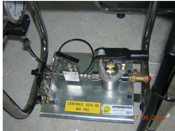
Montaggio senza serbatoio

Caratteristiche del montaggio con serbatoio :