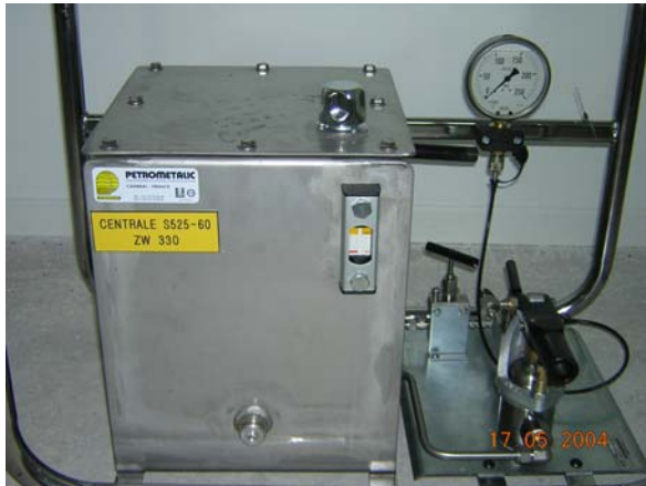
Montaggio con serbatoio